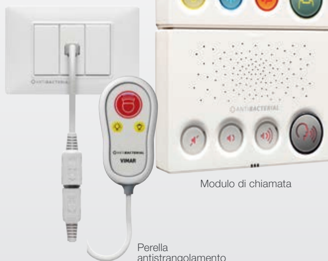
Modulo di chiamata

Pensato per garantire la gestione delle richieste dei pazienti con tempestività e definire la priorità di intervento, Call-way facilita inoltre l'organizzazione delle risorse memorizzando presenze, tempi di evasione delle chiamate, stato del sistema e personale disponibile.