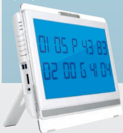
Display da corridoio

Il sistema viene gestito dagli accoppiatori di linea che formano la dorsale principale (ADL-EF) ed è conforme alla normativa VDE 0834-1-2. Il PC/display viene utilizzato per la gestione di log, statistiche, accorpamenti tra più reparti e chiamate vocali.