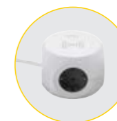
Prese tipo Schuko