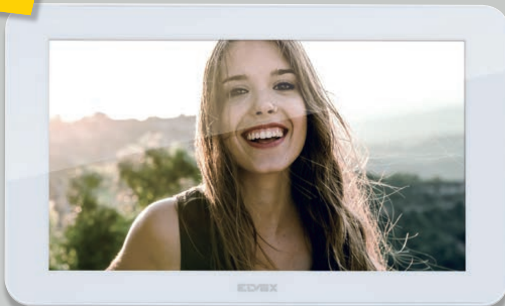
Monitor 7" viva voce touch screen