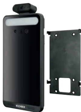
4626.08B con staffa da parete